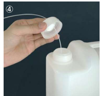
④ チューブを接続したキャップをボトル口に締め付けます