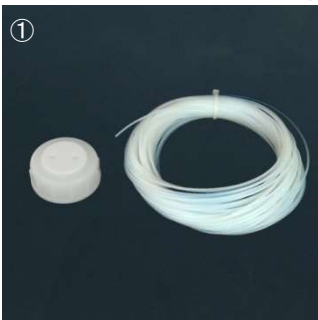
① ルアーポート付きキャップと外径 1/16"チューブを用意します