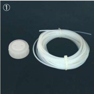
① ルアーポート付きキャップと外径 1/8"チューブを用意します