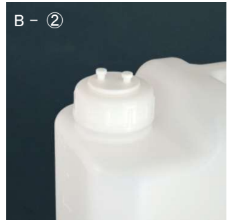
B - ② 全てのルアーポート部を別売 OM4251S で塞ぎます