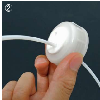
② ルアーポートに外径 1/8"チューブを貫通させます