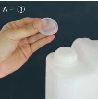
A - ① ボトル口に内蓋を嵌めます