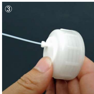
③ ルアーポートにチューブ接続済 OM4252S を差し込みます