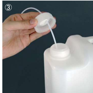
③ チューブを接続したキャップをボトル口に締め付けます