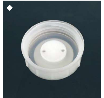
◆ ご使用前にキャップ内側にパッキンがあるか確認してください