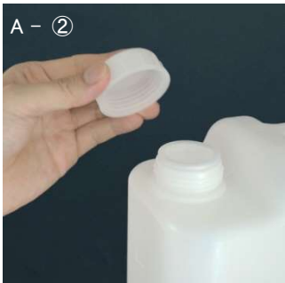
A - ② キャップをボトル口に締め付け密栓します